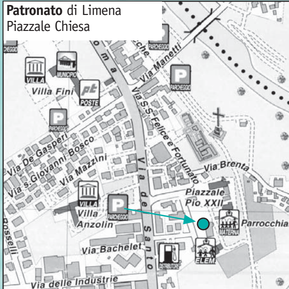
Patronato di Limena Piazzale Chiesa