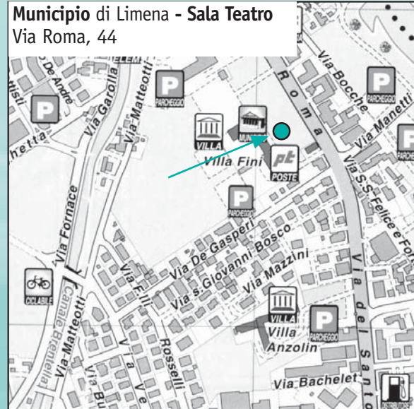
Municipio di Limena - Sala Teatro Via Roma, 44