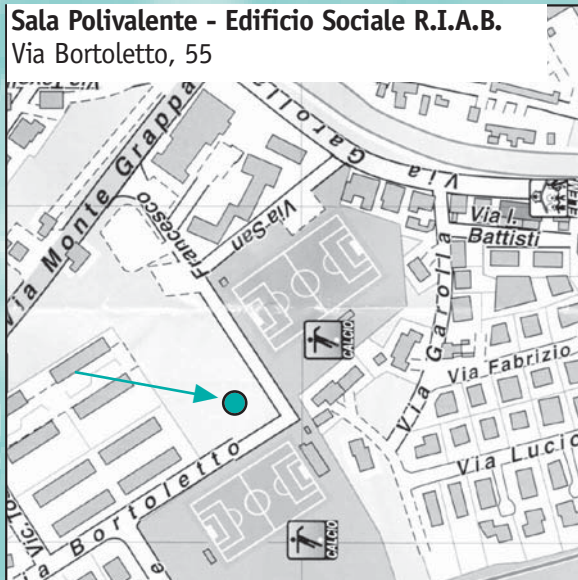
Sala Polivalente - Edificio Sociale R.I.A.B. Via Bortoletto, 55