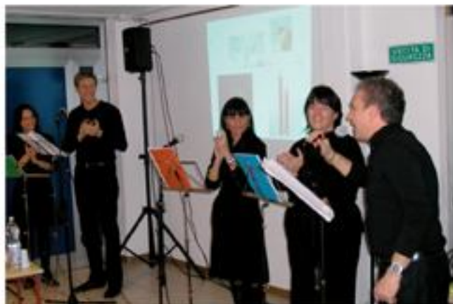
l "mattatori" de "Il LAPIS del FALEGNAME"