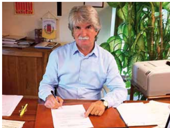
Il sindaco firma la prima polizza stipulata

Ogni sabato mattina sarà presente in sala consigliare un incaricato che darà informazioni sull'iniziativa.